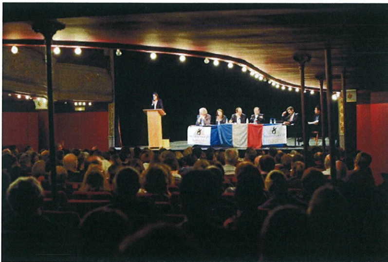
Débat "Rendre la Justice à la Démocratie" le 9 novembre 2010 au Théâtre Dejaset

134 personnes recommandent ça. Soyez le premier parmi vos amis.